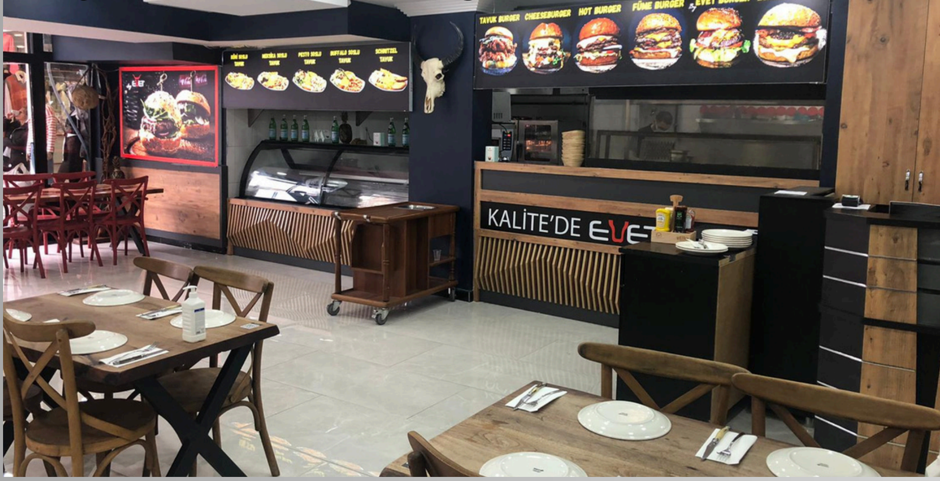
Proje Adı: Evet Burger