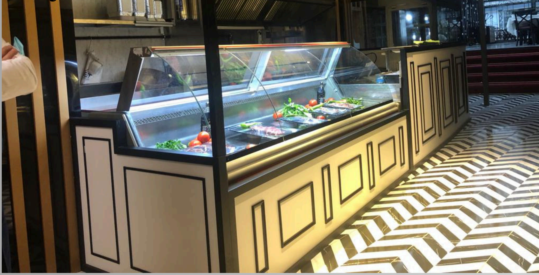
Proje Adı: Evet Steakhouse