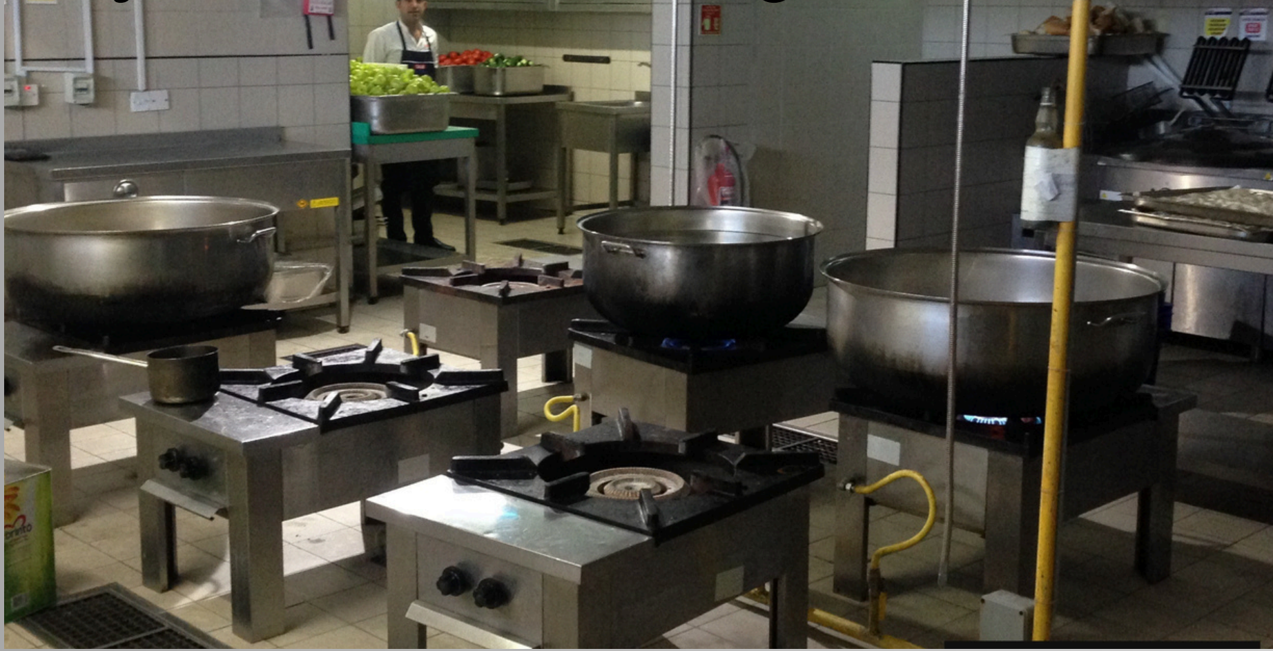
Proje Adı: PGC Catering