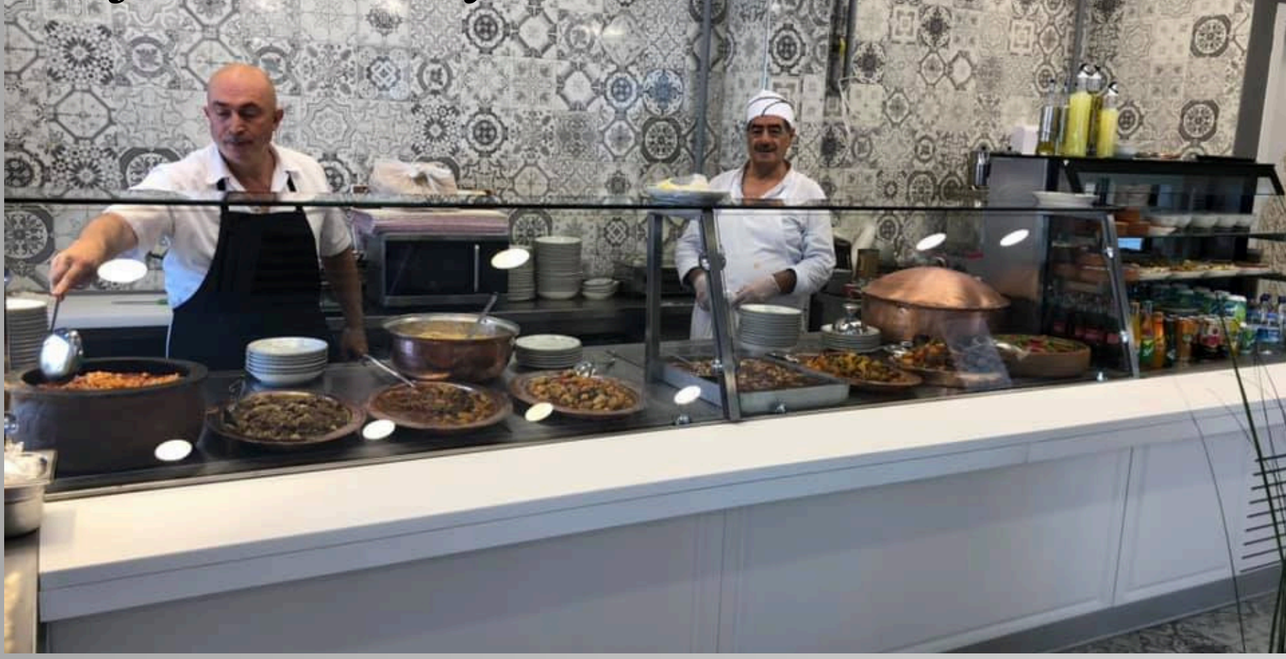
Proje Adı: Kalye Restaurant