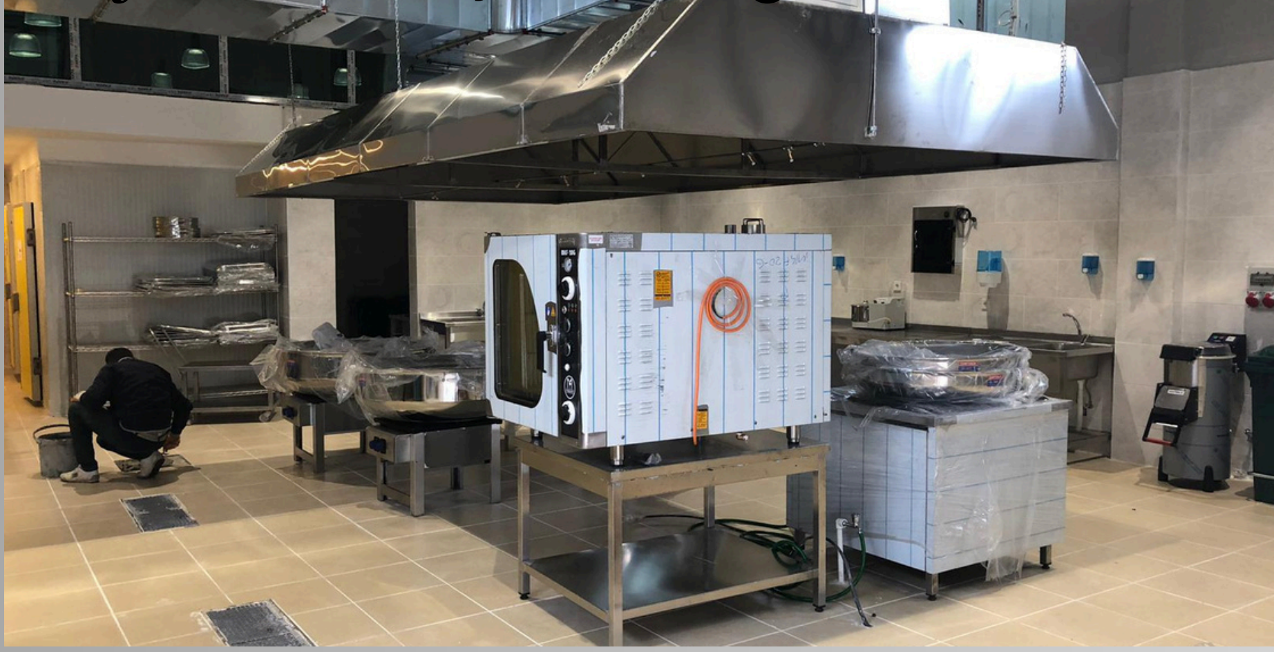
Proje Adı: Kılıç Catering